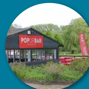
Le Pop-Up Bar