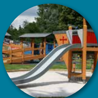
Plaines de jeux