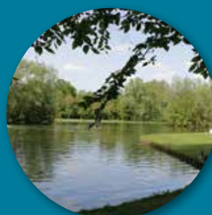
Étangs de pêche